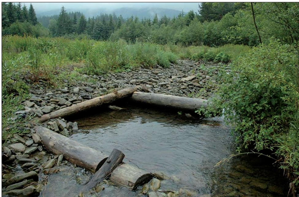
Obr. č. 2: Provedená stabilizace hlavního koryta Kněhyně se značným objemem zachyceného štěrku ve střední části revitalizované plochy (červen 2014).

Bylinné patro je zastoupeno jen nesouvisle,